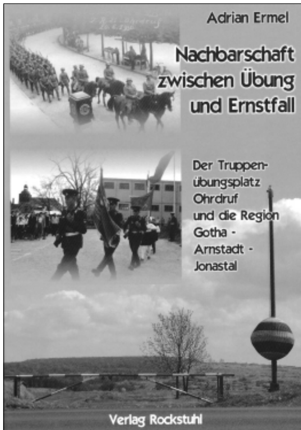
Dr. Adrian Ermel: Nachbarschaft zwischen Übung und Ernstfall, Der Truppenübungsplatz Ohrdruf und die Region Gotha - Arnstadt - Jonastal, Verlag Rockstuhl.

Natürlich könnte das jemand behaupten. Diejenige Person würde jedoch in meiner Dissertation dafür keine Anhaltspunkte finden. So gut wie alle Chroniken und Monographien über Militärstandorte in Deutschland fokussieren sich natürlich auf das Militärische – und das meist in einer »positiven«, also un-