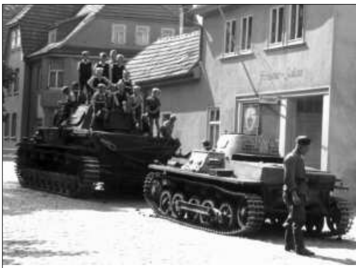
Die 1940er Jahre: »Interessante Fahrzeuge« für die Jugend.

Allerdings muss ich zugeben, dass auch ich im Laufe meiner Recherchen auf Hinweise und Quellenfragmente gestoßen bin, die durchaus vermuten lassen, dass sich zwi-