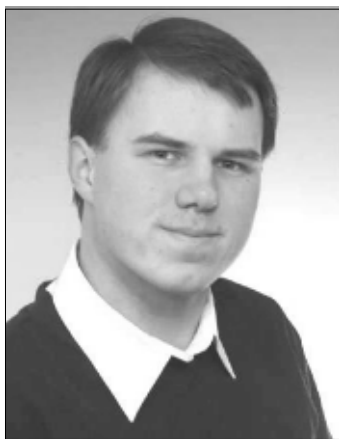
Unser Autor: Sebastian Schreiner