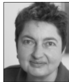
Annelie Buntenbach, Mitglied im Bundesvorstand des DGB

Ein allgemeiner gesetzlicher Mindestlohn von 8,50 Euro pro Stunde könnte dem Staatshaushalt im Jahr sieben Milliarden Euro Mehreinnahmen beschieren. Für fünf Millionen Erwerbstätige würden die Arbeitseinkommen steigen. Entsprechend kämen knapp 2,7 Milliarden Euro mehr an Steuern und Sozialbeiträgen in die Kassen, die Ausgaben für Arbeitslosengeld II, Sozialhilfe oder Wohngeld könnten dagegen um 1,7