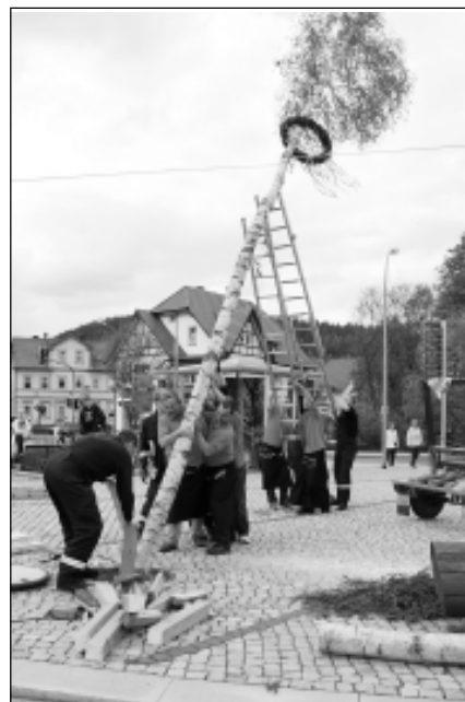
Mit Hilfe der Freiwilligen Feuerwehr wird jedes Jahr der Maibaum auf dem Schlossplatz aufgestellt, hier 2010.