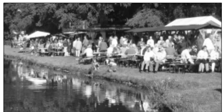
Der GKV organisiert das jährlich stattfindende Hammerteichfest, hier 2010. Befreundete Vereine nehmen an den bekannten Wasserspielen teil.