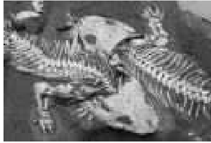
Das »Tambacher Liebespaar«.

Im vergangenen Sommer entdeckte ein internationales Wissenschaftler-Team unter der Leitung des Kustos im Gothaer Museum