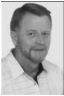
Unser Autor: Klaus Perlt