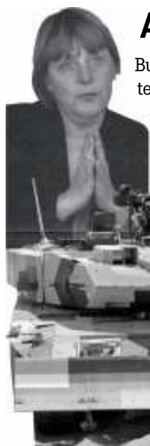
Titelzeile und Montage: ks/Gerler

Bundeskanzlerin Merkel und Außenminister Westerwelle inszenieren sich gerne als Unterstützer der arabischen Demokratiebewegung. Doch hinter den Kulissen hätscheln sie die Diktatoren: Vor wenigen Wochen erlaubte der Bundessicherheitsrat die Lieferung von 200 deutschen Leopard-Kampfpanzern an das saudische Regime. Dem Gremium gehören auch Merkel und Westerwelle an.