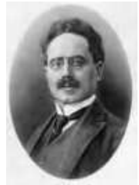
Karl Liebknecht geboren am 13. August 1871 ermordet am 15. Januar 1919

Karl Liebknecht zur Kriegssitzung des Reichstages