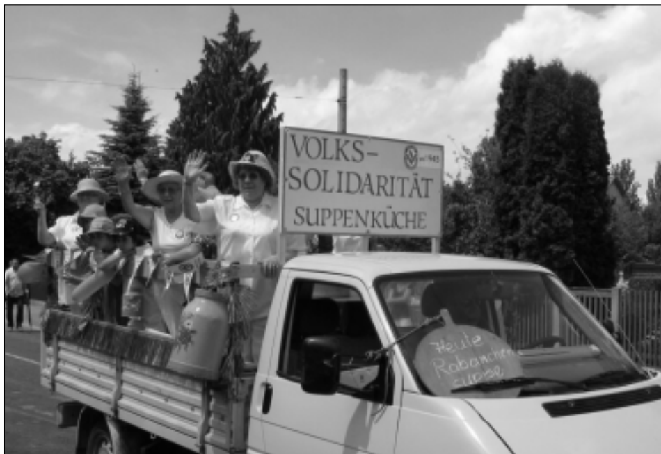
Beim Festumzug anlässlich des Thüringentages gab es von den Frauen der Volkssolidarität Rapanchensuppe.

>>> seine Weise mit geholfen. Dabei haben Vorstand und Geschäftsführer größtenteils gemeinsam Zielstellung für Zielstellung abgearbeitet. Es mussten personelle und räumliche Veränderungen vorgenommen werden. Und so sieht die Bilanz heute aus: