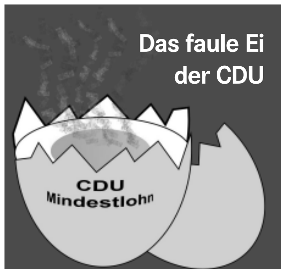
Grafik: Volker Pöschel

Die Einführung eines flächendeckenden gesetzlichen Mindestlohns würde hingegen bedeuten, dass alle Unternehmen ihn zahlen müssten. Alle Marktteilnehmer hätten die gleichen Voraussetzungen, und ein