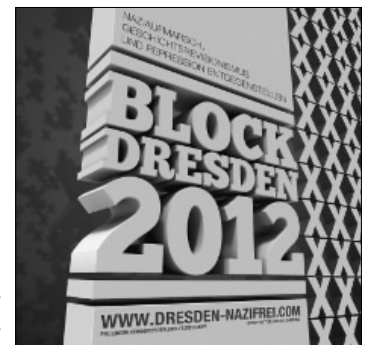
Blockieren, bis der Naziaufmarsch Geschichte ist

Wir geben den Nazis keinen Meter Straße preis. Wir blockieren sie in Dresden: bunt und lautstark, kreativ und entschlossen! Nie wieder Faschismus! Nie wieder Krieg! Aufruf des Bündnisses »Dresden Nazifrei 2012« (redaktionell leicht gekürzt.) Text und Grafik: www.dresden-nazifrei.com