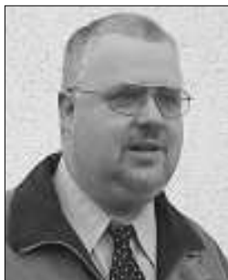
Unser Autor: Ralph Dobrawa

Anrufe bei Chefredakteuren und Vorstandsvorsitzenden großer Zeitungen sind jedenfalls nicht geeignet, dem Ansehen des Amtes zu dienen, wenn damit eine Sonderbehandlung für die eigene Person eingefordert wird. Das hat Wulff inzwischen längst erkannt. Dabei kann noch dahingestellt bleiben, ob die Drohung »mit einem empfindsamen Übel«, wie es der Jurist formuliert – nämlich dem »Krieg mit der Presse« –, schon die Ebene einer versuchten Nötigung erreicht.